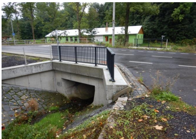
Kritický bod - propustek pod silnicí podél Jeřice

Ohrožení zvýšenými průtoky z extravilánu v lokalitě Růžek. Propustek drobného vodního toku pod silnicí.