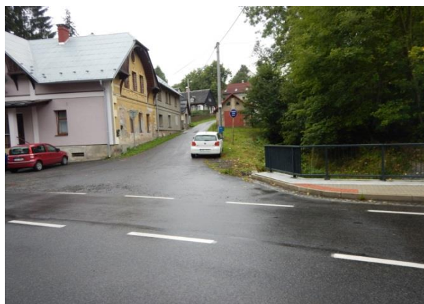
Kritický bod (napravo)